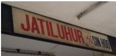
Gambar 13 Jati Luhur D/H Sin Hoo