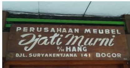
Gambar 4 Djati Murni D/H Hang

Toko Djati Murni adalah salah satu toko di Jalan Suryakencana yang menjual perabotan meubel. Pada papan nama toko masih menggunakan ejaan lama yang memberikan ciri klasik pada toko tersebut. Selain itu, terdapat nama lama Hang yang ada pada papan nama toko yang mencerminkan pendiri dari toko tersebut adalah orang keturunan Tionghoa.