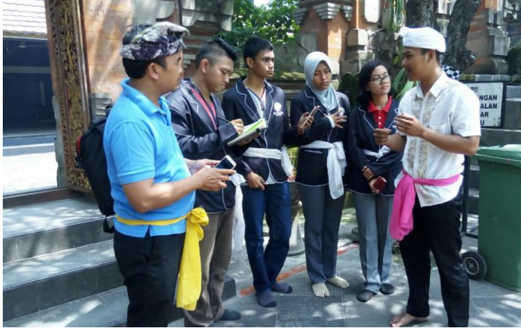
Gambar 1 Penyuluh menerima tamu dari lintas iman.

Proses komunikasi yang dikembangkan oleh Hall adalah menyelaraskan antara penerima dan pemberi pesan. Pemanfaatan teori reception analysis sebagai pendukung dalam kajian terhadap khalayak sesungguhnya hendak menempatkan khalayak tidak semata pasif namun dilihat sebagai agen kultural ( cultural agent ) yang memiliki kuasa tersendiri dalam hal menghasilkan makna dari berbagai wacana yang ditawarkan media.