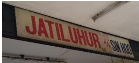
Gambar 1 Toko Jati Luhur D/H Sin Hoo