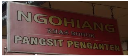
Gambar 8 Ngohiang