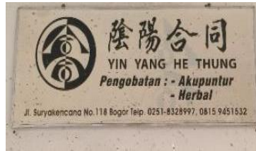
Gambar 9 Yin Yang He Thung 陰陽合同

Yin Yang He Thung 陰陽合同 (Yīnyáng hétóng) merupakan salah satu toko pengobatan akupuntur yang ada di Jalan Suryakencana. Letaknya Jl. Suryakencana No.118 Bogor. Toko ini mencantumkan bahasa Mandarin pada papan nama toko. Dari hal tersebut diduga bahwa pengobatan ini didirikan oleh keturunan Tionghoa. Paduan unsur nama, produk, alamat, telepon, dan logo ditemukan dalam contoh nama toko Yin Yang He Thung 陰陽合同. Terdapat unsur produk yang menjelaskan produk yang dijual oleh toko Yin Yang He Thung 陰陽合同.