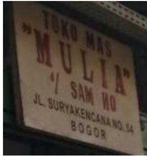
Gambar 11 Toko Mulia D/H Sam Hoo