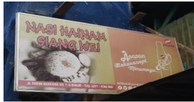
Gambar 6 Nasi Hainam Siang Wei

Toko Nasi Hainam (hainan 海南 Hǎinán ) terdapat di Jl. Suryakencana Bogor. Penggunaan bahasa Mandarin pada unsur nama yang ada pada papan nama toko 'Siang Wei'. Dalam Bahasa Mandarin nama toko 'Siang Wei' memiliki hanzi 香味 ( Xiāngwèi ) yang artinya wangi/wewangian.