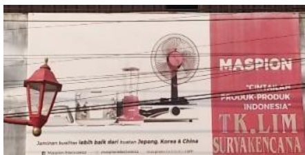
Gambar 3 Toko Lim