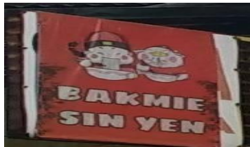
Gambar 7 Bakmi Sin Yen

Bakmie yang merupakan salah satu jenis sajian mie yang di populerkan oleh pedagang Tiongkok ke Indonesia. Bakmi pertama kali ditemukan di dataran Tiongkok pada masa Dinasti Han Timur yang berkuasa pada circa 25 hingga 200 setelah Masehi. Penggunaan bahasa Mandarin pada unsur nama yang ada pada papan nama toko ‘Sin Yen’. Terdapat unsur produk ‘Bakmie’ yang merupakan salah satu jenis sajian mie yang di populerkan oleh pedagang Tiongkok ke Indonesia. Dalam Bahasa mandarin nama ‘Sin Yen’ memiliki hanzi ‘心妍’ ( xīnyán ) yang memiliki makna 心 ( xīn ) ‘hati’ dan 妍 ( yán ) ‘cantik’. Unsur nama yang ada pada papan nama toko ‘Yin Yang He Thung 陰陽合同’. 阴阳