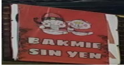
Gambar 16 Bakmie Sin Yen