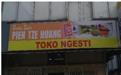
Gambar 18 Toko Ngesti

Dari contoh gambar 17 dapat diketahui bahwa terdapat papan nama toko yang memiliki gabungan antara bahasa Hokkian dan bahasa Indonesia. Toko ini bernama 'Tjong Jaya', dimana 'Tjong' merupakan