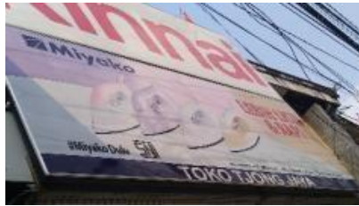
Gambar 17 Toko Tjong Jaya

Papan nama toko yang terdiri dari dua unsur dan terdiri dari paduan unsur nama dan iklan tidak cukup memberikan informasi tentang lokasi dan produk yang dijual oleh toko. Dapat dilihat pada gambar-gambar berikut: