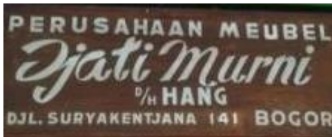
Gambar 12 Djati Murni D/H Hang