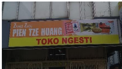
Gambar 14 Toko Ngesti

Iklan adalah berita pesanan untuk mendorong, membujuk khalayak ramai agar tertarik pada barang dan jasa yang ditawarkan. Hasil pengamatan terhadap unsur iklan papan nama toko di Jalan Suryakecana, ditemukan iklan menjadi satu bagian dengan papan nama toko. Berikut contoh papan nama toko yang terdapat iklan di dalamnya.