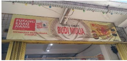
Gambar 15 Toko Budi Mulia

Unsur iklan yang mengandung bahasa Mandarin ditemukan pada Toko Ngesti yang memiliki iklan obat Zhang Zhou Pien Tze Huang. Obat ini adalah obat tablet secara Traditional Chinese Medicine (TCM) merupakan herbal yang berkhasiat untuk membersihkan panas dan lain-lain. Terdapat juga Toko Budi Mulia yang memiliki iklan obat Fu Fang Ejjiao Jiang. Obat ini menggunakan Fu Fang yang sudah digunakan sejak dinasti Tang (618-907).